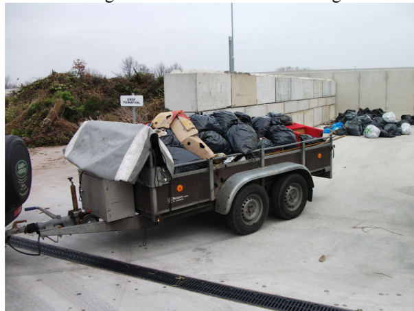
Wederom een volle aanhanger met gevonden afval

Het aangetroffen afval bestond ondermeer uit een stoel, vensterbanken, spiegels, volle doos met sinasappels, puzzels, glaswol, autobanden, oude kleren en vanzelfsprekend veel lege flesjes en blikjes. Nadat de vrijwilligers getrakteerd waren op worstenbrood en koffie konden we het gevonden afval kosteloos afleveren bij de nieuw milieustraat van de gemeente. Het bestuur wil alle vrijwilligers die meegewerkt hebben aan de Nationale schoonmaakdag bedanken voor hun medewerking.