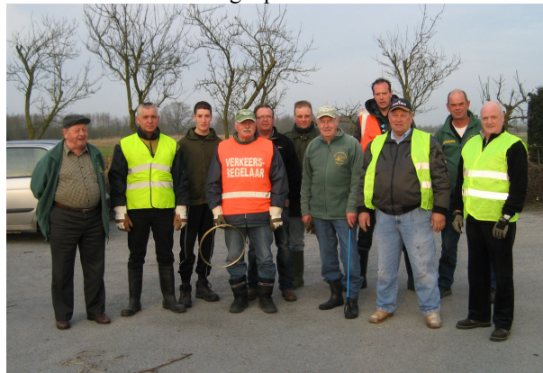
Een aantal van de vrijwilligers

Zaterdag 17 maart heeft onze vereniging weer haar jaarlijkse bijdrage geleverd aan de Nationale Schoonmaakdag. Dit jaar hadden we geluk. Het was een stralende dag, die wel fris begon, maar dat laatste kon de pret niet drukken en was het lekker werken in de buitenlucht. Een elftal vrijwilligers, waaronder gelukkig ook een paar nieuwe gezichten, heeft de bermen langs de Leurse Haven en langs de wateren in de Zwartenbergse polder ontdaan van zwerfvuil.