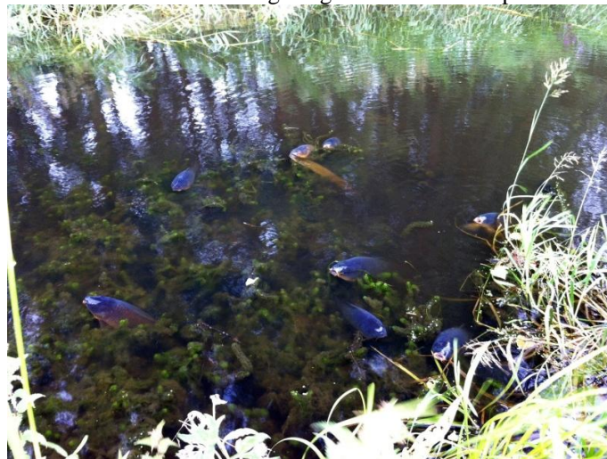
Naar lucht happende karpers en snoeken

toen het verschijnsel op dat "het keren van het water" wordt genoemd. Namelijk het warme water aan de bodem stijgt naar boven en het afgekoelde water aan de oppervlakte zakt naar de bodem. Maar omdat het water aan de bodem veel afvalstoffen bevat van afgestorven en rottende planten werd dit hierdoor door het hele water gemengd, waardoor het rottingsproces versneld werd en het zuurstofgehalte ineens snel omlaag ging. Het zuurstofgehalte werd zelfs zo slecht dat de vissen aan de oppervlakte naar zuurstof gingen happen. De eerste dag hebben de vissen het nog overleefd, maar de tweede dag hadden veel vissen het te zwaar met als gevolg dat er vissterfte op trad.