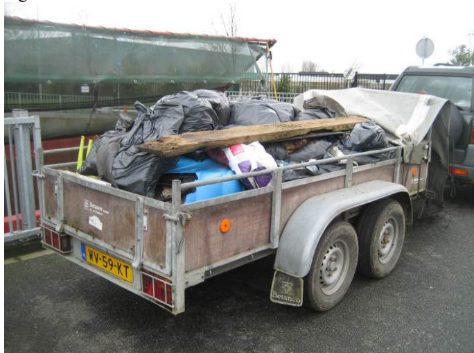
Toch weer een volle aanhanger tijdens de Nationale Schoonmaakdag

Zoals gebruikelijk was er na afloop koffie en warm worstenbrood voor de deelnemers waarna een volle aanhangwagen met zwerfvuil op de milieustraat werd afgeleverd.