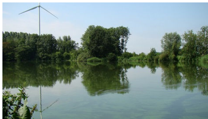
Zandwiel met blauwalgen

Op de Zandwiel in de Zwartenbergse polder heeft zich, alweer bijna een jaar geleden, een grote vissterfte voorgedaan waarbij vrijwel de gehele visstand om het leven is gekomen. De meeste karpers, waaronder karpers van meer dan 40 jaar oud, hebben het niet overleefd. Verder zijn er dode snoeken, baarzen, zeelten en palingen aangetroffen. De oorzaak van de vissterfte is het afsterven van de blauwalgen, die de laatste jaren gedurende de zomermaanden volop in de Zandwiel aanwezig zijn. Het afsterven van de blauwalgen verbruikt veel zuurstof. Zoveel zelfs dat het zuurstofgehalte van het water geheel opgebruikt is en het water zuurstofloos is geworden, waardoor de vissen zijn gestorven.