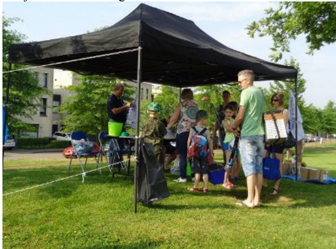
Drukke bij het aanmelden voor de Nationale Hengeldag

Net zoals de laatste paar jaar vond het evenement dit jaar ook weer plaats aan de visvijver in de Schoenmakershoek waar achttien kinderen zich onder een stralende hemel meldden bij de organisatoren. Omdat het in 2017 tijdens de Nationale Hengeldag een zeer warme dag was geweest hebben we besloten om dit jaar vroeger te beginnen met onze activiteiten, zodat we rond de middag klaar zouden zijn. Ook dit jaar was het weer een warme dag en bleek het een goede keus geweest te zijn om eerder te beginnen.