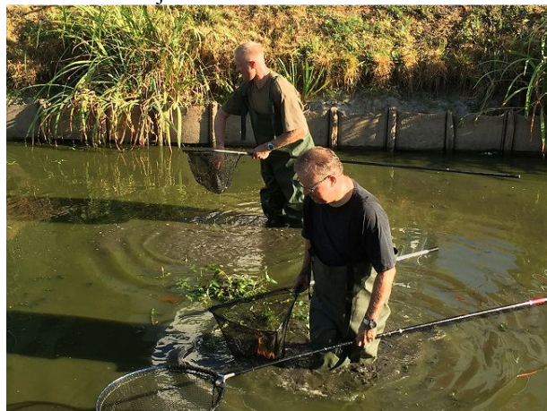
Vrijwilligers vis aan het redden