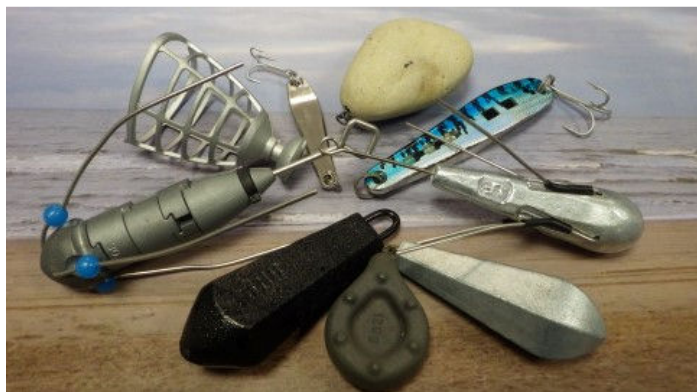
Enkele lood alternatieven

Waterschappen, Natuurmonumenten, Dibevo en Sportvisserij Nederland heeft als doel de komende jaren het gebruik van lood binnen de sportvisserij volledig af te bouwen. Lood wordt door sportvissers veelal gebruikt als werpgewicht en komt – door verlies – soms in het water terecht. Lood is een ongewenste stof, giftig voor mens en dier. Op veel plekken in de samenleving is daarom het gebruik van lood al teruggedrongen en/of verboden. Denk aan benzine, verf, waterleidingen en in de jacht. Binnen Europa komt echter vooralsnog geen verbod op het gebruik van lood in de hengelsport. De Nederlandse hengelsport zet zich al jaren in voor een schoon watermilieu en daar hoort lood niet in thuis. Sportvisserij Nederland heeft daarom besloten het gebruik van lood zo snel mogelijk te gaan afbouwen. Een beter milieu begint immers bij jezelf.