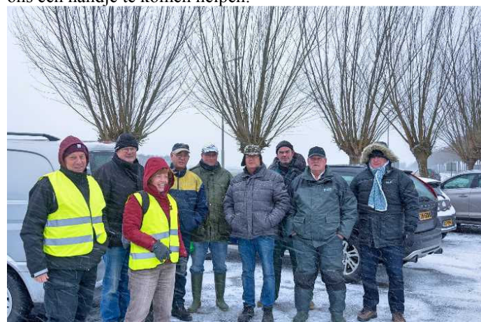
Winterse omstandigheden tijdens de Nationale Schoonmaakdag

Op zaterdag 17 maart zou onze vereniging tijdens de Nationale Schoonmaakdag weer de Zwartenbergse Polder en de oevers van de Leurse Haven gaan schoonmaken. Echter had het in de nacht van vrijdag op zaterdag dermate gesneeuwd dat er ongeveer 3 cm sneeuw lag. Enkele diehards hadden toch de sneeuw getrotseerd en waren om 08:00 uur naar het verzamelpunt bij de Zwartenbergse molen gekomen. Ook de directeur van Sportvisserij Zuidwest Nederland en twee mensen van Water Natuurlijk waren hiernaar toe gekomen om ons een handje te komen helpen.