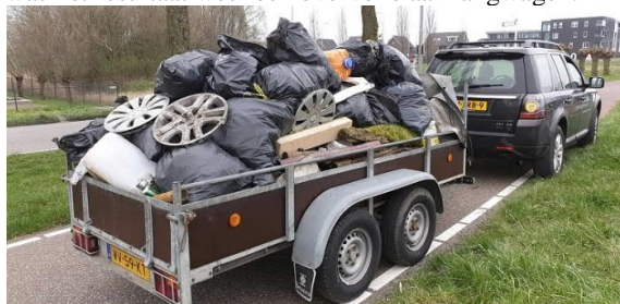
Overvolle aanhanger na afloop Landelijke Opschoondag

Hoe mooi zou het zijn als we aan het eind van een dag van werken in de polder konden zeggen "geen of weinig afval gevonden" om vervolgens voldaan huiswaarts te keren. Helaas is de praktijk anders. Na enkele uren van hard werken, bukken, in en over sloten springen en soms zware voorwerpen torsen was het resultaat weer een overvolle aanhangwagen.