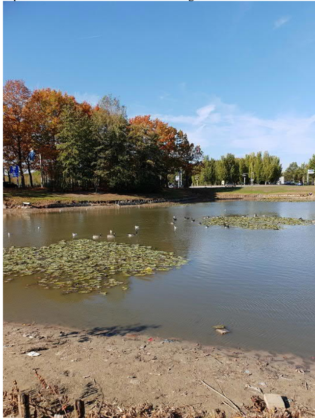
Zeer lage waterstand in de vijver in de Hoge Neerstraat

Het zal niemand ontgaan zijn dat er in het afgelopen jaar heel wat gebeurd is rondom de vijver in de Hoge Neerstraat. Via dit artikel willen we jullie op de hoogte brengen van wat er allemaal gebeurd is en wat er nog staat te gebeuren. In 2018 hebben we een extreem droge zomer en najaar gehad. Dit had tot gevolg dat het waterpeil in de vijver heel ver daalde. Zo ver zelfs dat op de diepste plekken van de vijver nog maar zo'n 50 cm water stond. Dat het water zo ver kon dalen had een aantal oorzaken, zoals verdamping door het warme weer, het in de grond wegzakken van het water door de zeer lage grondwaterstand in die periode en er werd door diverse aannemers veelvuldig water uit de vijver gepompt om bomen en andere planten water te geven. De watermonsternemer van onze vereniging heeft een aantal keer per week de waterkwaliteit van de vijver gemeten om te bepalen of de situatie voor de vissen nog aanvaardbaar was of niet.