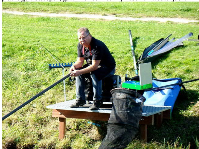
Nieuwe visstoep in gebruik

Afgelopen winter is een langgekoesterde wens van onze vereniging gerealiseerd, het creëren van extra visstoepen langs de Leurse haven. Aan het Jaagpad, tussen de Slickbrug en de Coen de Koningbrug, is door een aantal vrijwilligers van onze vereniging hard gewerkt. Nadat het bestuur de voorbereidende administratieve verplichtingen had afgerond en een professioneel grondwerkbedrijf eerst de dragende palen in de grond had gedruild, zijn daar door zelfwerkzaamheid van een aantal van onze leden de dwarsliggers op aangebracht. Hierna zijn daarop roosters van 1,50 bij 1 meter vastgemaakt met als resultaat 34 prachtige visstoepen, geschikt voor het vrij vissen en wedstrijden.