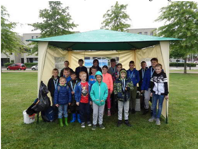
De deelnemers aan de Nationale Hengeldag

Zoals al jaren gebruikelijk heeft HSV De Kleine Voorn ook dit jaar weer deelgenomen aan de Nationale Hengeldag, een initiatief van Sportvisserij Nederland. Het doel van de Nationale Hengeldag is om het sportvissen en de hengelsportverenigingen te promoten op de dag dat vroeger het nieuwe visseizoen geopend werd. HSV De Kleine Voorn geeft hier invulling aan door activiteiten te organiseren voor onze jeugdleden. Ook niet leden waren van harte welkom om kennis te maken met onze mooie sport. Onder begeleiding van een aantal vrijwilligers hebben 22 kinderen, al dan niet lid van onze vereniging (deelname was vrij), deelgenomen aan de activiteiten die werden georganiseerd in het kader van de Nationale Hengeldag. Jammer genoeg heeft het gedurende het gehele evenement geregend wat de diehards, want dat waren deze deelnemers zeer zeker, niet weerhield om tot het einde te blijven. Slechts een van de aanwezigen verliet voortijdig het strijdtoneel. Naast een wedstrijd waar vanzelfsprekend de meeste belangstelling naar uit ging, konden de jeugdige aanwezigen met vragen terecht bij hun meer ervaren collega vissers. Helaas liet de vis het tijdens de wedstrijd afweten en hebben maar vier kinderen, in totaal zes vissen gevangen.