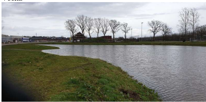
Mogelijk nieuw viswater in woonwijk De Streek

Als vereniging proberen we zoveel mogelijk water voor onze leden beschikbaar te krijgen, zodat zij voldoende keus hebben om te kunnen gaan vissen. Met de gemeente Etten-Leur is in het verleden de afspraak gemaakt dat HSV De Kleine Voom de vereniging binnen Etten-Leur is waaraan de visrechten van een water verhuurd gaan worden. Sinds een aantal jaar is men begonnen met de aanleg van de nieuwe woonwijk De Streek aan de zuidkant van Etten-Leur. Aangezien we aan die kant nog geen viswater hebben en de waterpartijen in die woonwijk mooie wateren zijn om daar straks te kunnen gaan vissen heeft onze vereniging het verzoek bij de gemeente Etten-Leur ingediend om het visrecht van de wateren in De Streek aan onze vereniging te gaan verhuren. Zodra we daar een positief antwoord op hebben ontvangen van de gemeente dan zal dit door middel van een bijlage van de Verenigingslijst van Viswateren toegevoegd worden aan de te bevissen wateren van HSV De Kleine Voom.